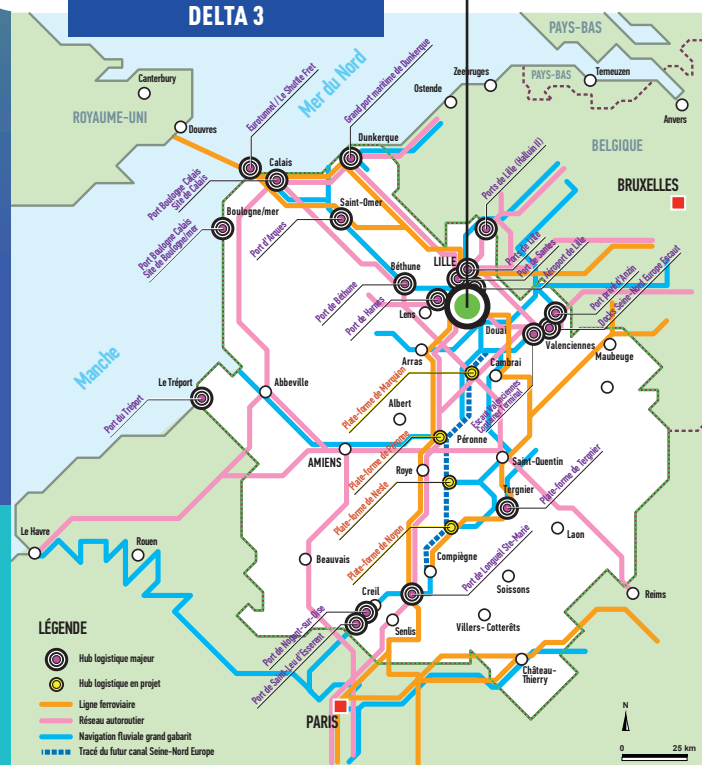
PLATE-FORME MULTIMODALE DELTA 3